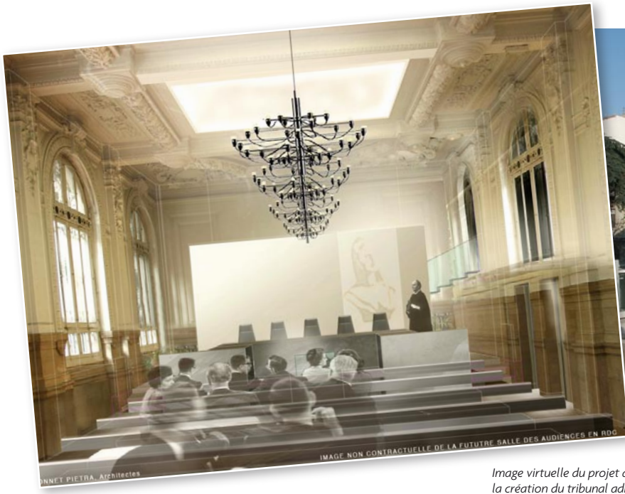
Image virtuelle du projet de salle d'audience pour la création du tribunal administratif de Toulon.