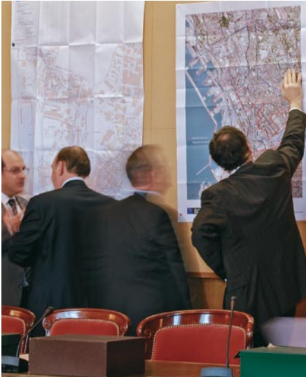
Une séance de la section des travaux publics réunissant des membres du Conseil d'État et des représentants du gouvernement.