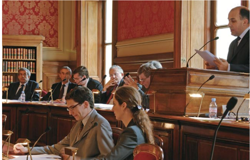
La sección de lo contencioso actuando en calidad de juez: juzga los asuntos que presentan una dificultad particular en el plano de la técnica jurídica.