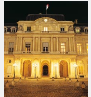
Nueva instalación del tribunal administrativo de Nimes.