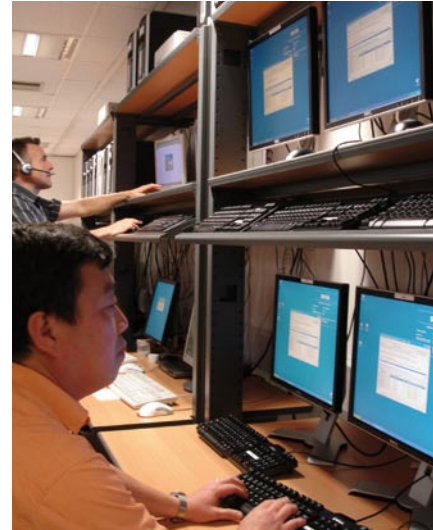
Un sistema moderno de informática para la gestión de los expedientes desplegado en el Consejo de Estado, los tribunales y las cortes.