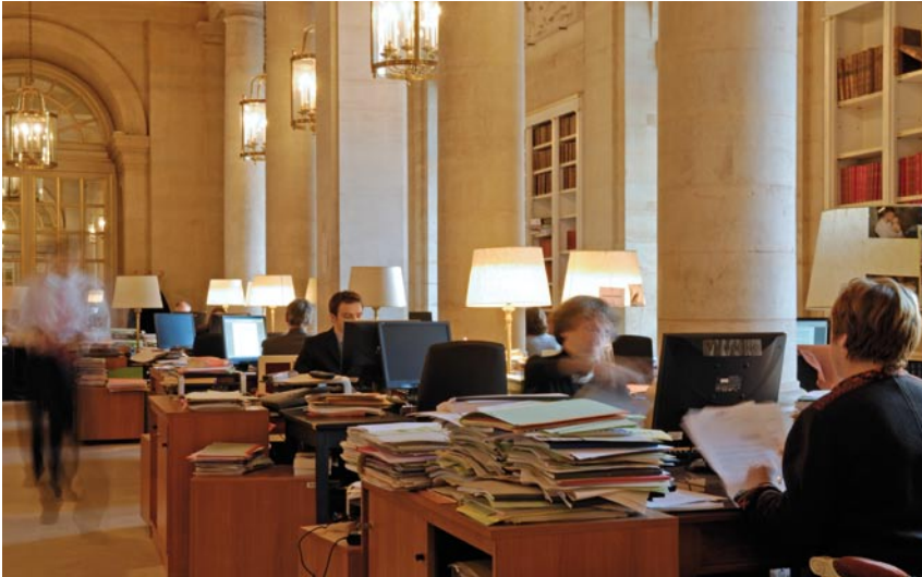
Ambiente de trabajo en la sala Parodi.