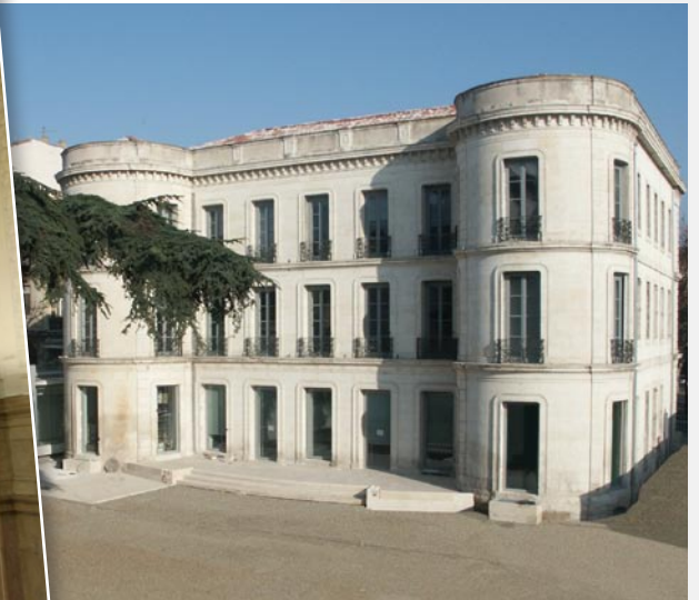
Imagen virtual del proyecto de la sala de audiencia para la creación del tribunal administrativo de Toulon.