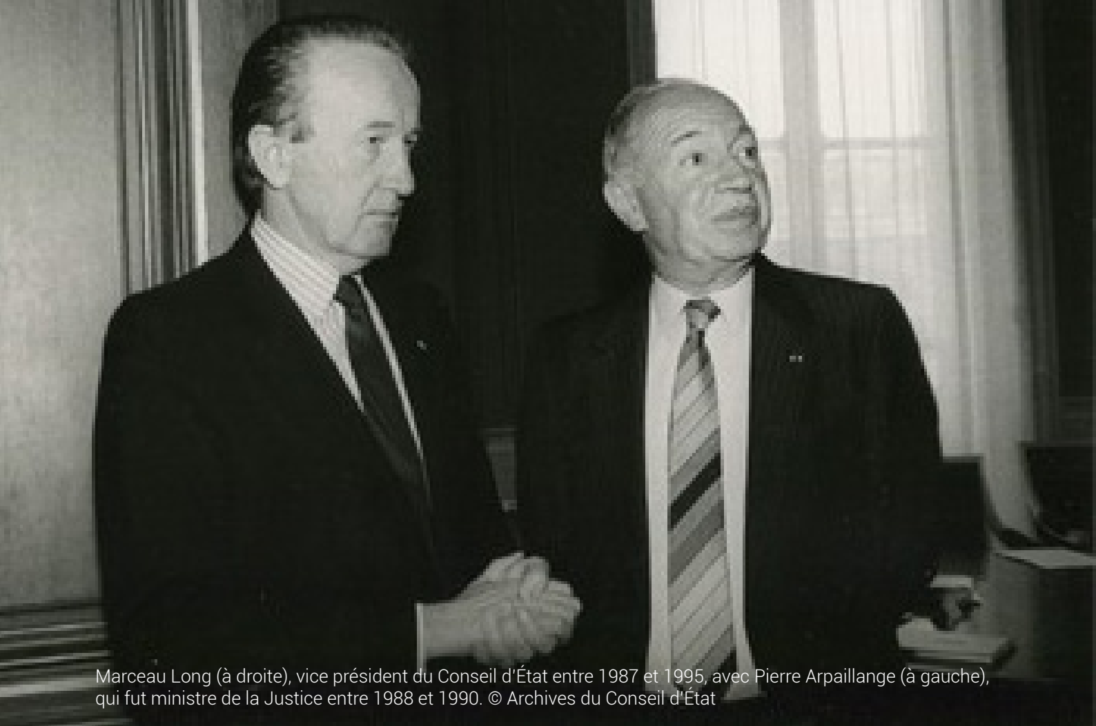
Marceau Long (à droite), vice président du Conseil d'État entre 1987 et 1995, avec Pierre Arpaillange (à gauche), qui fut ministre de la Justice entre 1988 et 1990.